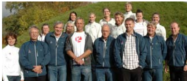
Hordaland Idrettskrets har gjennomført Rent idrettslag.

Hordaland Idrettskrets er første idrettskrets som har skaffet seg Rent idrettslagssertifikat. Gjennomføringen fant sted i forbindelse med en samling 10. oktober. Nå oppfordrer de alle idrettslag/idrettsråd i sin krets til å gjennomføre Rent idrettslag.