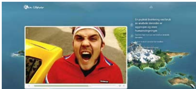
Aksel Lund Svindal, prøvde det nye e-læringsprogrammet til Antidoping Norge under årets WC på Kvitfjell.